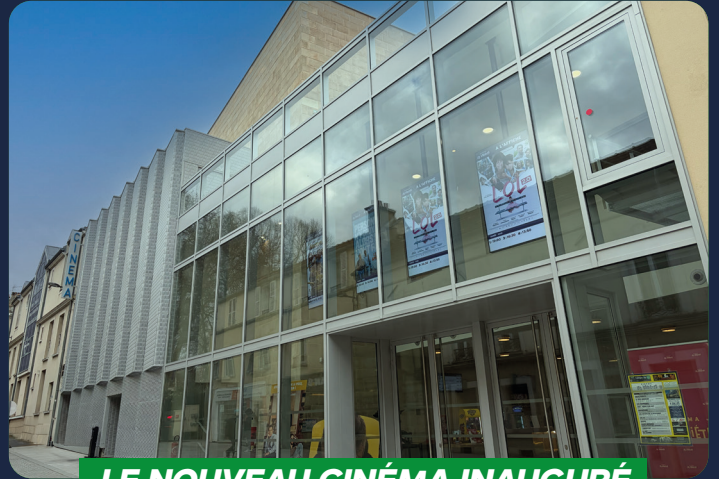
LE NOUVEAU CINÉMA INAUGURÉ