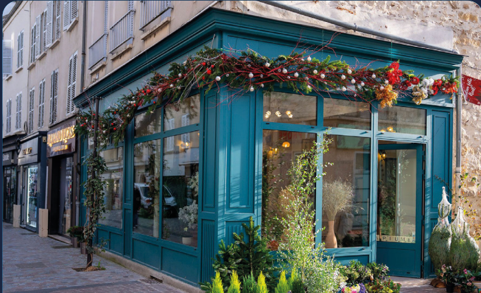
UN CAPITAL DE 3M D'EUROS RÉUNI POUR RÉNOVER ET LOUER 35 FUTURES BOUTIQUES