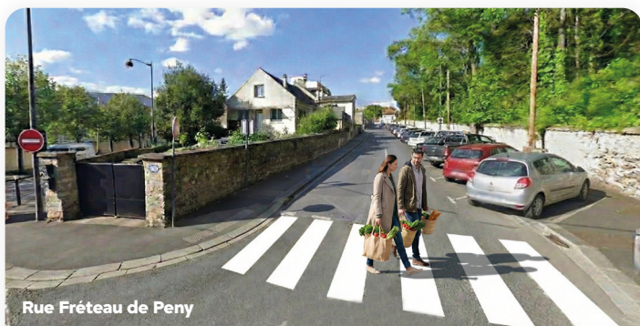
Rue Fréteau de Peny

Le futur Parking Lebarbier comptera 230 places, contre 100 aujourd'hui, avec des stationnements vélos sécurisés et des bornes de recharge électriques, le tout recouvert par un parc urbain. Fin des travaux en 2029.