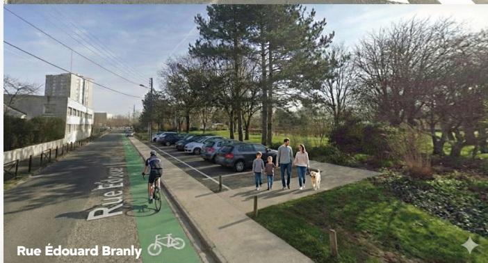
Rue Édouard Branly