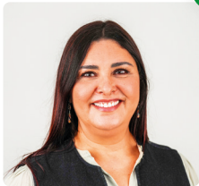
Salima Yenbou 54 ans Inspectrice Éducation Nationale - Ancienne députée Européenne