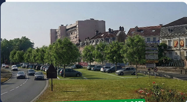
BOULEVARD CHAMBLAIN PARKING VÉGÉTALISÉ