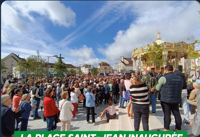
LA PLACE SAINT-JEAN INAUGURÉE