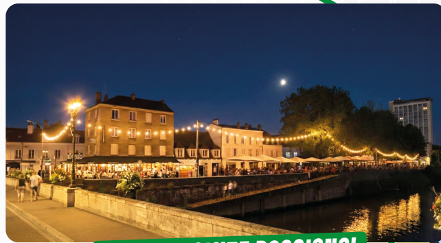
QUAI HIPPOLYTE ROSSIGNOL PIÉTONNISATION LE WEEK-END