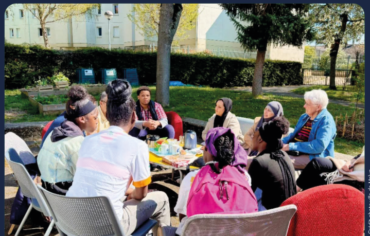
BUDGET DES CENTRES SOCIAUX DOUBLÉ