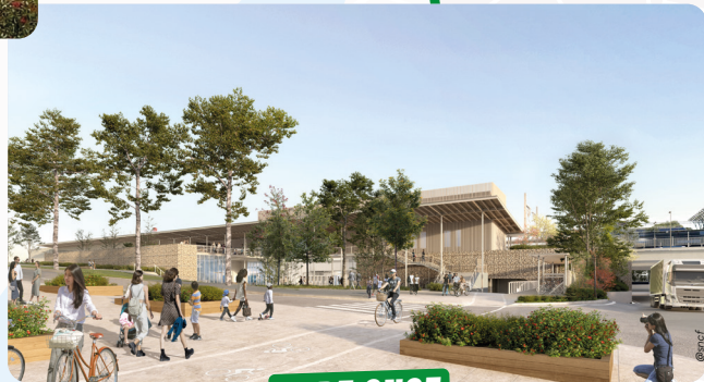
GARE SNCF RÉNOVATION ENTIÈRE DE LA GARE ET DU QUARTIER

CHATEAUBRIAND - BEAUREGARD - LORIENT RÉHABILITATION ET RECONSTRUCTION DE LOGEMENTS MODERNES (ANRU 2)