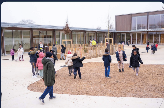
DEUX NOUVELLES ÉCOLES INAUGURÉES