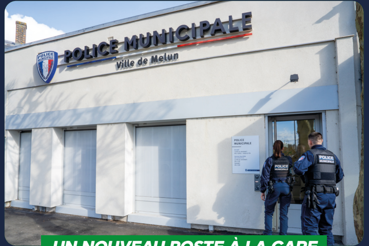
UN NOUVEAU POSTE À LA GARE